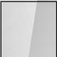
Kopf schützen ○