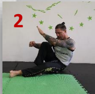
Sturz zur Seite ○