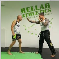
Abwehrhaltung und „Stopp“ sagen ○